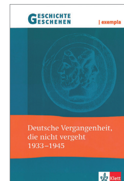
Geschichte und Geschehen – exempla