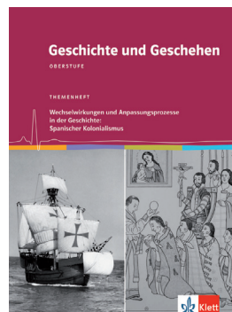
Geschichte und Geschehen Themenhefte