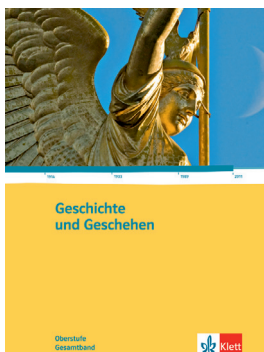
Geschichte und Geschehen Oberstufe Gesamtband