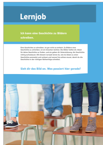
Das kannst du schon.

Mit der Vorwissenseite „Das kannst du schon.“ kannst du mit wenigen Aufgaben das bereits Erlernte wiederholen und deinen Wissensstand auffrischen.