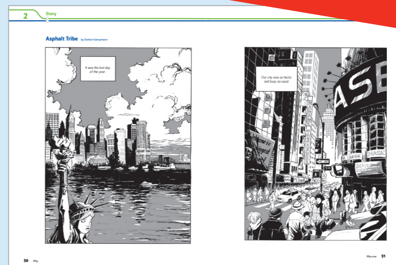
aus Green Line 4