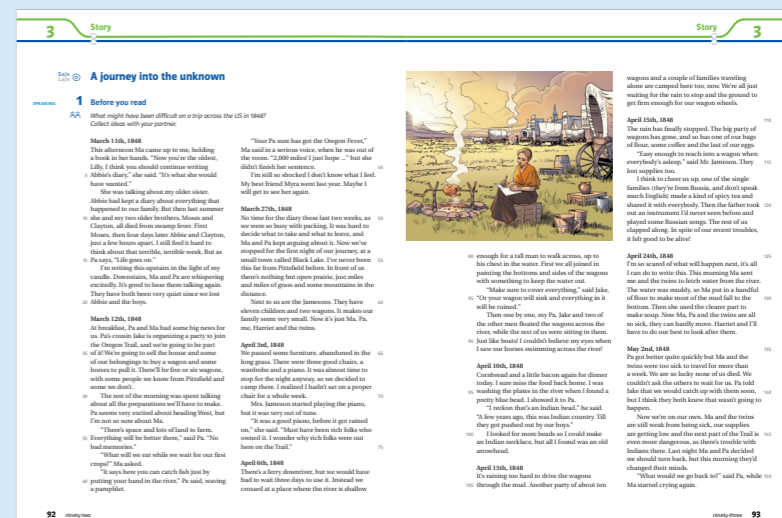
aus Green Line 4