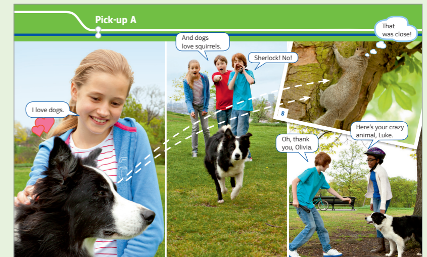
aus Green Line 1