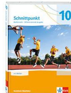
Schulbuch 10 ISBN: 978-3-12-744401-8