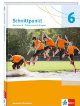
Schulbuch 6 ISBN: 978-3-12-744761-3