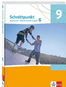
Schulbuch 9G ISBN: 978-3-12-744411-7