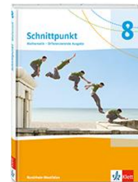
Schulbuch 8 ISBN: 978-3-12-744481-0