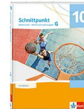
Schulbuch 10G ISBN: 978-3-12-744421-6