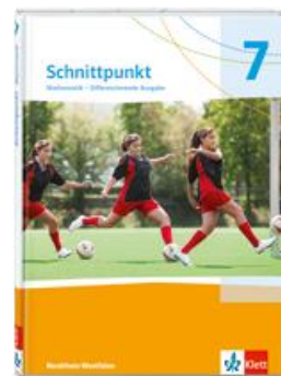
Schulbuch 7 ISBN: 978-3-12-744471-1