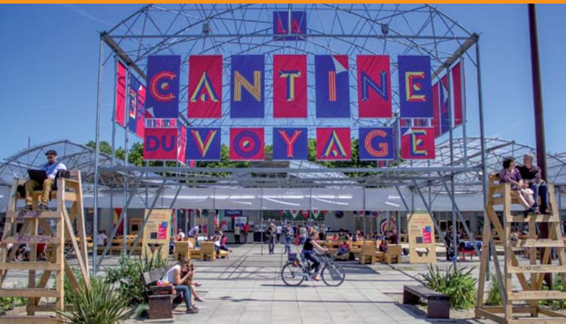
Parc des chantiers