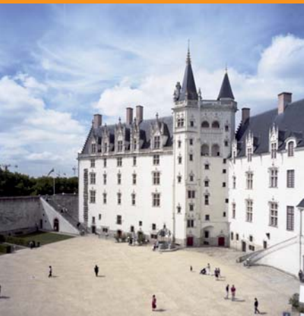
Le château des Ducs de Bretagne