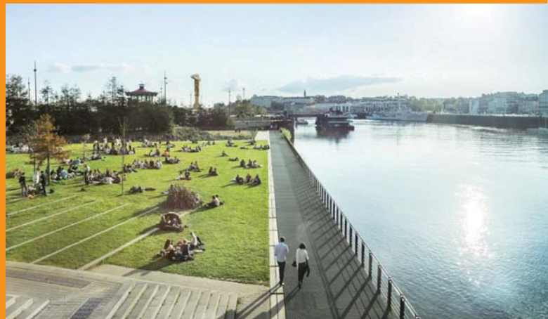
Ile de Nantes

néo-classique ponctué de riches ornements, fait toujours la fierté des Nantais qui aiment y flâner.