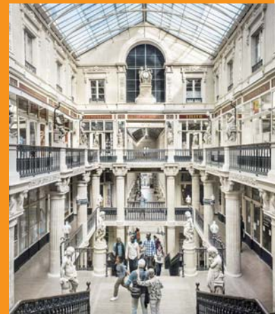
Le passage Pommeray